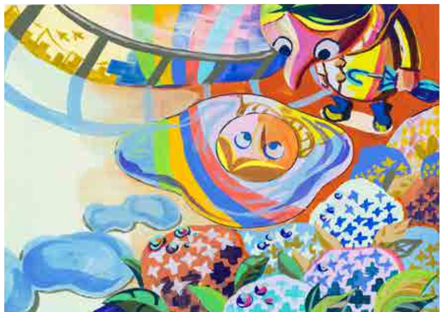
「雨のあとのきらめき」